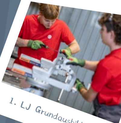
1. LJ Grundausbildung