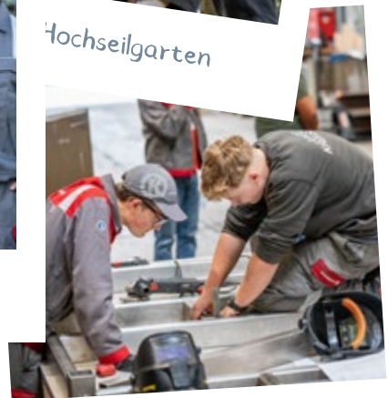
Stahlbau im Technikum