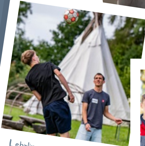
Lehrlingstage in Schleglberg