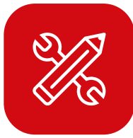
Lehre mit Matura